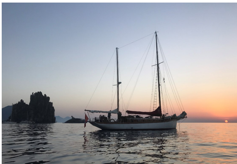
Tout sera fait pour que vous puissiez à nouveau profiter de belles soirées et de belles navigations à bord d'Helena 1913

Si une croisière devait être modifiée nous en aviserions dès que possible les équipiers concernés.