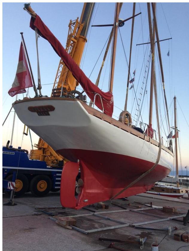
La manutention d'Helena au port exige l'engagement de moyens lourds ... et coûteux

Helena navigue beaucoup plus que la plupart des autres bateaux de plaisance. Il est d'usage de dire que des voiles durent cent semaines ; ceci représente de très nombreuses années pour la majorité des bateaux de croisières ... mais à peine quatre ans pour notre ketch qui navigue près de six mois par an.