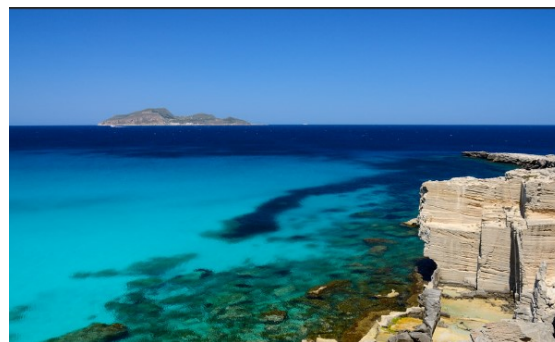
Dans les îles Egades