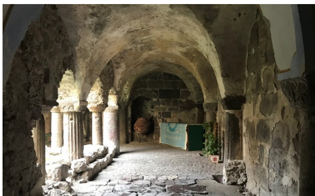
A la découverte des monuments de Lipari