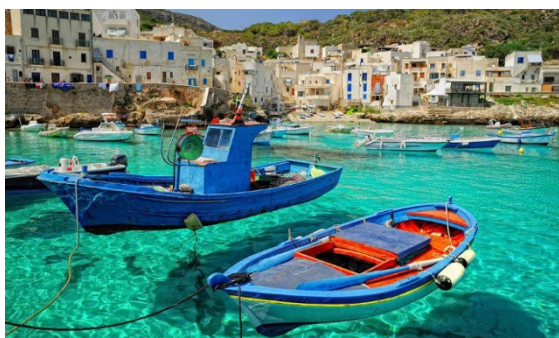
Entre Catane et Trapani