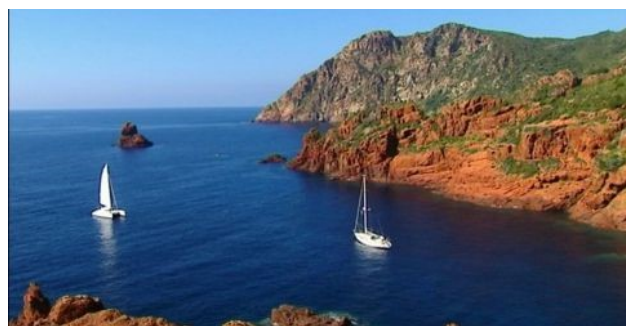
Mouillage le long de la côte corse