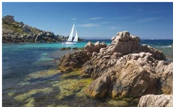
Dans les Iles Lavezzi