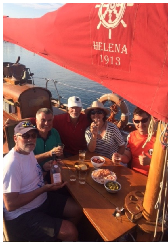
L'apéritif est servi à bord !

Vous pouvez envoyer vos questions en mentionnant la ou les croisières qui vous intéressent à info@helena.ch , nous transmettrons votre demande au skipper qui vous contactera.