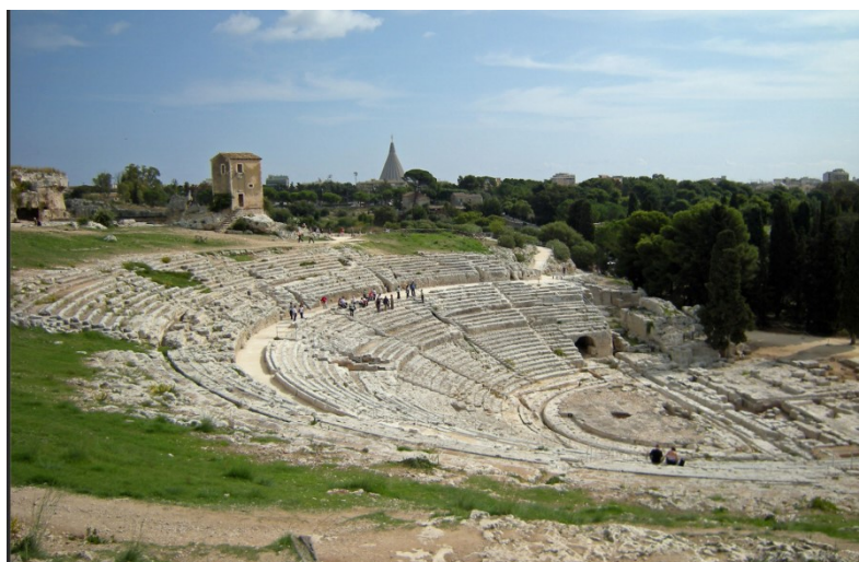
Syracuse : le théâtre grec