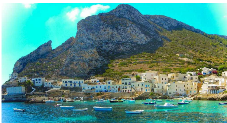
Dans les îles Egades