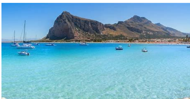
Le cap San Vito