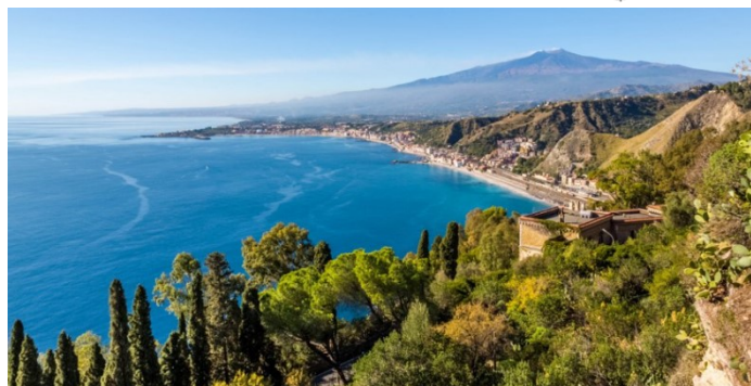
Environs de Taormina