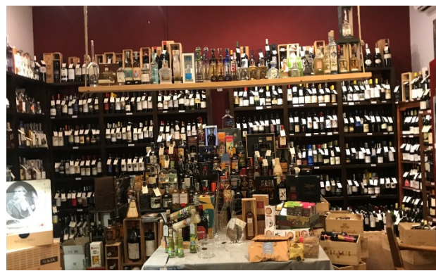
Les vins des îles éoliennes