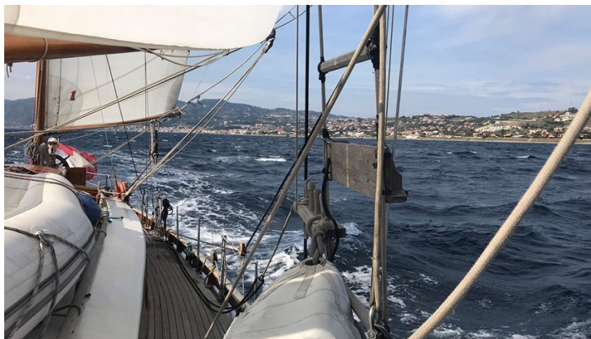
Helena franchissant le détroit de Messine